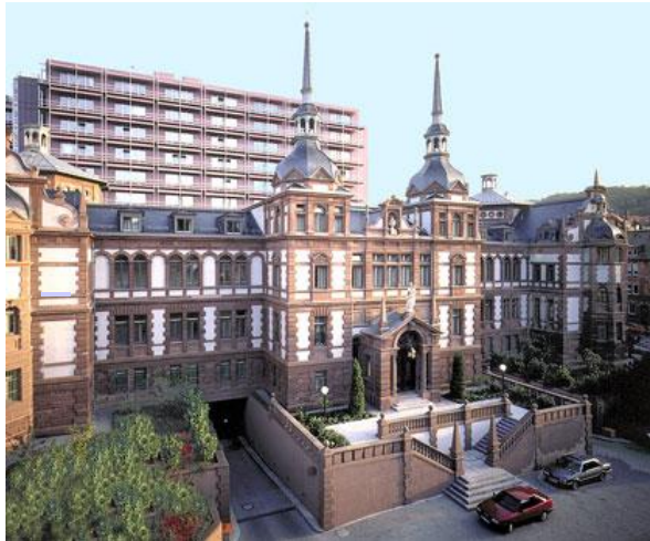
Marienhospital Stuttgart MVZ GmbH (Strahlen-/Nuklearmedizin)