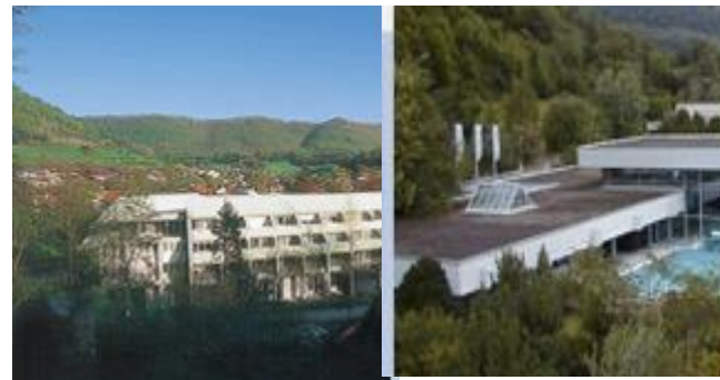
Vinzenz Klinik & Vinzenz Therme