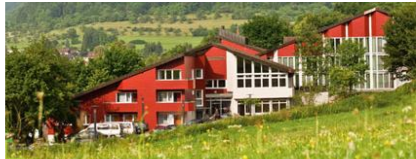
Luise von Marillac Klinik