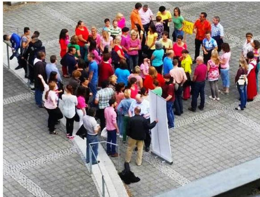
Farbtupfer vor der Arbeitsagentur: Aktion des Jobcenters Breisgau-Hochschwarzwald zum „Diversity-Tag“

Ganz schön bunt – so gestaltet der Jobcenter für den Landkreis Breisgau-Hochschwarzwald den dritten "Diversity-Tag". Ein Smart-Mob zog am Vormittag rund 50 bunt gekleidete Leute auf den Platz vor der Freiburger Arbeitsagentur.